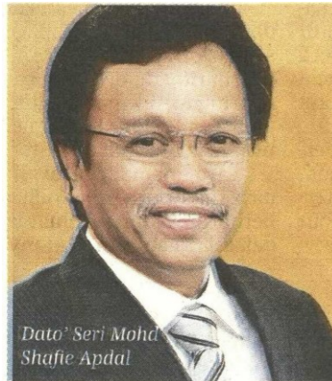
Dato' Seri Mohd Shafie Apdal